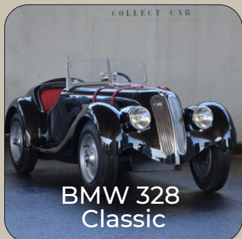
BMW 328 Classic

Né sous la bannière De la Chapelle-Stimula à la fin des années 70, puis commercialisée par BMW à échelle réduite, produite dans les ateliers BERARD à Lyon, la BMW 328 de 1936 nous revient suite à un déménagement en Provence chez Collect Car.