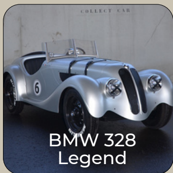
BMW 328 Legend

Né sous la bannière De la Chapelle-Stimula à la fin des années 70, puis commercialisée par BMW à échelle réduite, produite dans les ateliers BERARD à Lyon, la BMW 328 de 1936 nous revient suite à un déménagement en Provence chez Collect Car.