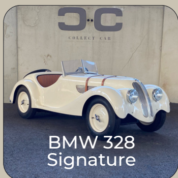
BMW 328 Signature